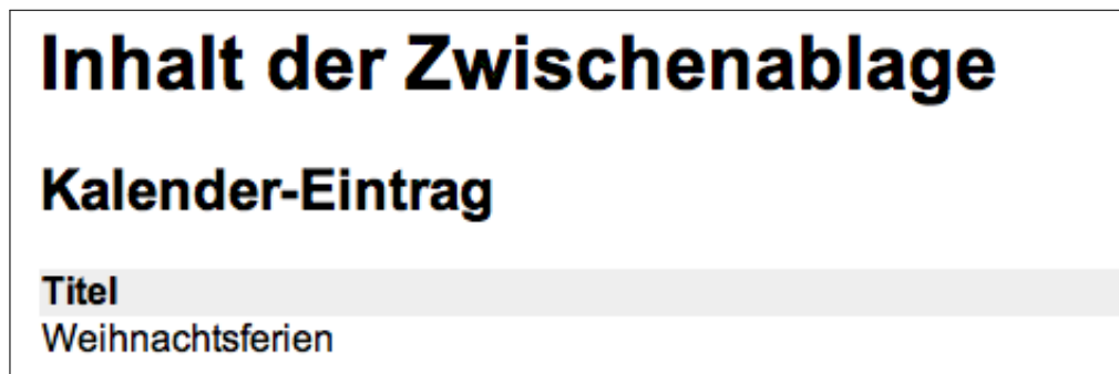
Abbildung 5: Bildschirmfoto der Zwischenablage nach Kopieren eines Termins

Nach dem Kopieren eines Termins wurde der Termin in den temporären Speicher kopiert, sie können den Termin auch in der Zwischenablage einsehen (Klemmbrettsymbol neben dem eigenen Benutzer-Namen oben rechts). Ein Beispiel entnehmen Sie Abbildung 5.